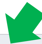
信息披露提交列表

IPE将对企业上传的文件进行审核，审核时间约为1-2个工作日； 如为异常数据，IPE在核实后将对数据进行修约。